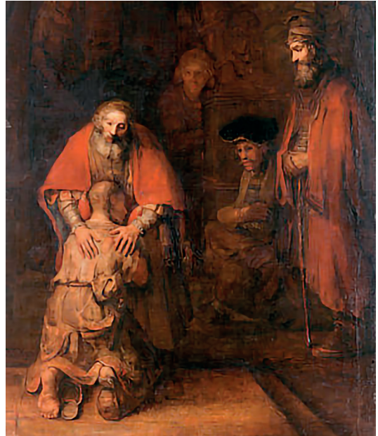
“El Retorno del Hijo Pródigo” Museo del Hermitage, San Petersburgo

Somos unas 25 personas, nos dan unos resúmenes. Primero hay una exposición, y después nos piden nuestra opinión acerca de la Palabra.